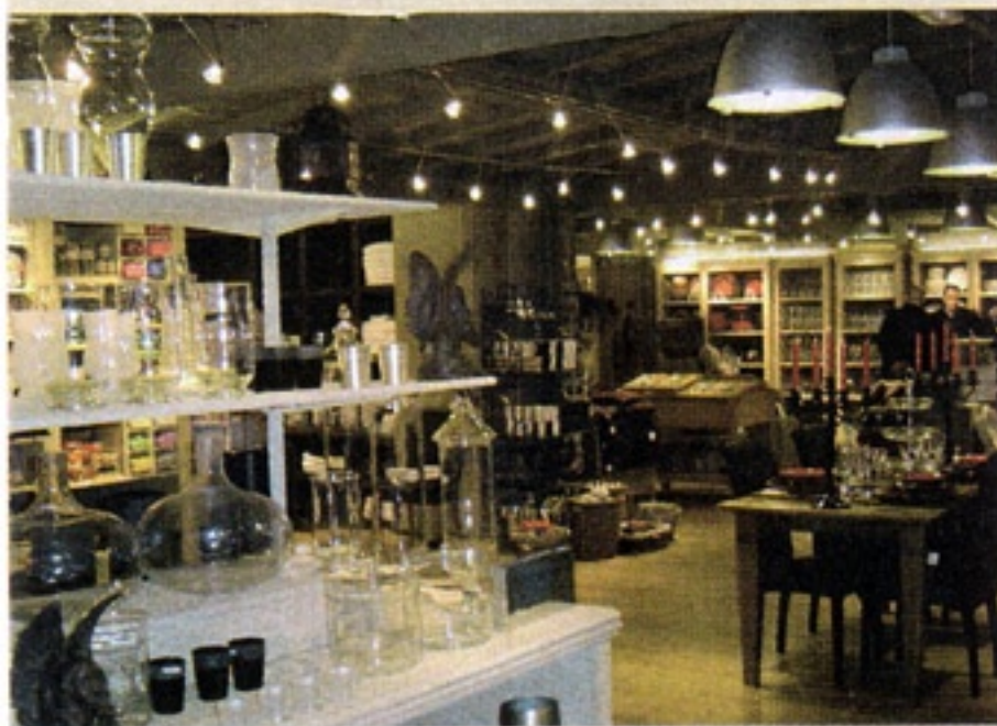
Côté Maison, Centre des Tanneurs à Lille. Tél. : 03 20 06 41 34.